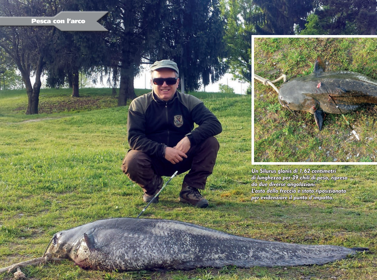
Un Silurus glanis di 1,62 centimetri di lunghezza per 39 chili di peso, ripreso da due diverse angolazioni. L'asta della freccia è stata riposizionata per evidenziare il punto d'impatto.